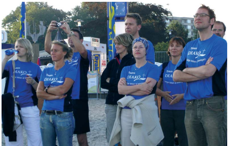
Spannung beim Team DIAKO am Strand von Glücksburg, an dem der Wettkampf begann.

des Kinesiotaping testen wollten. Der Veranstalter war von der Vorstellung so sehr angetan, dass er alle Mitwirkenden spontan zur Pastaparty einlud. Bei der