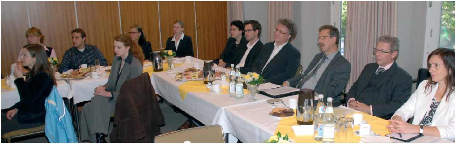
Arbeitsbedingungen der Pflegekräfte auf dem Prüfstand: Die Initiatoren und FH-Studenten bei der Vorstellung der Projektergebnisse im Flidnersaal der DIAKO.