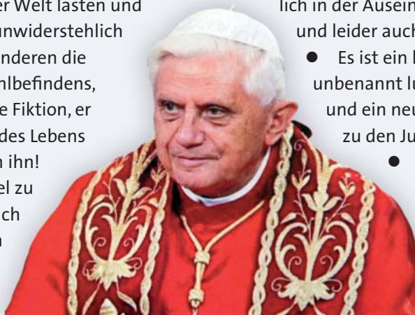
Papst Benedikt XVI.

gefallen ist – wie Jesus im Gleichnis vom barmherzigen Samariter erzählt – heute der vergessene und geplünderte Kontinent Afrika zu verstehen ist. Neue Akzente setzt der Papst in der Verhältnisbestimmung zwischen der katholischen Kirche und dem Judentum und holt damit einen Prozess der Bewusstmachung nach, wie er im evangelischen Lager schon vollzogen ist und u.a. seinen Niederschlag in unserer Kirchenverfassung gefunden hat: „Die Nordelbische Evangelisch-Lutherische Kirche bezeugt die bleibende Treue Gottes zu seinem Volk Israel. Sie ist im Hören auf Gottes Weisung und in der Hoffnung auf die Vollendung der Gottesherrschaft mit dem Volk Israel verbunden.“ In dem Hineinhören in den jüdisch-christlichen Dialog des New Yorker Rabbiners Jacob Neusner erkennt er die Zugehörigkeit Jesu zum