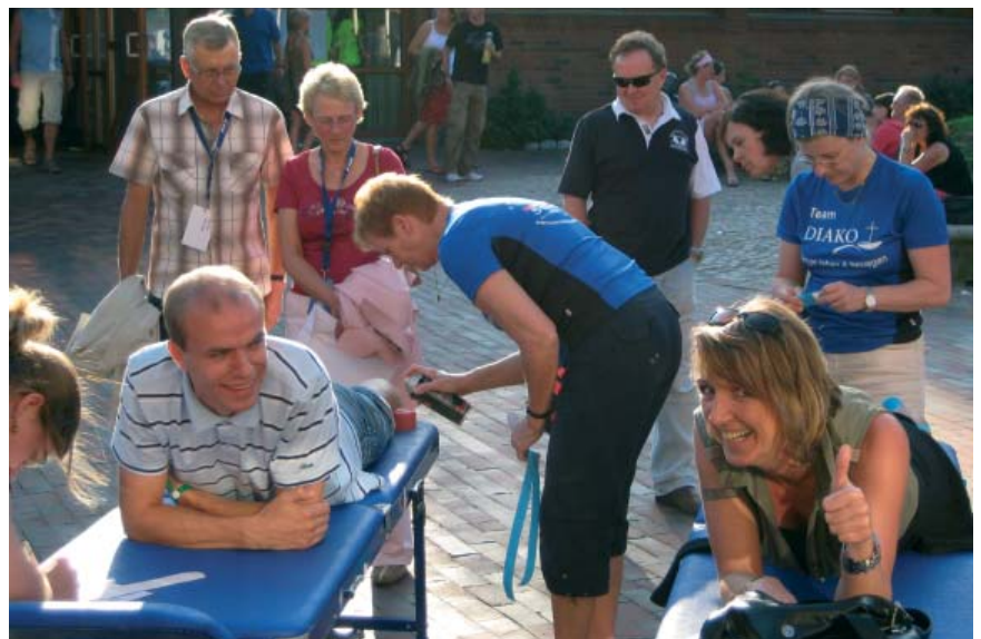
Andrang: Sportler und Interessierte nutzten gleichermaßen das Kinesiotaping-Angebot der DIAKO.