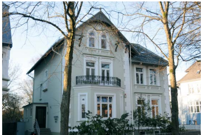
Die Psychiatrische Tagesklinik , die ebenfalls zur DIAKO-Klinik für Psychiatrie, Psychosomatik und Psychotherapie gehört, feiert am 18. Mai ihr 20-jähriges Bestehen. Geplant ist unter anderem ein Tag der offenen Tür. Das Programm wird noch im Internet und in der Presse bekannt gegeben.