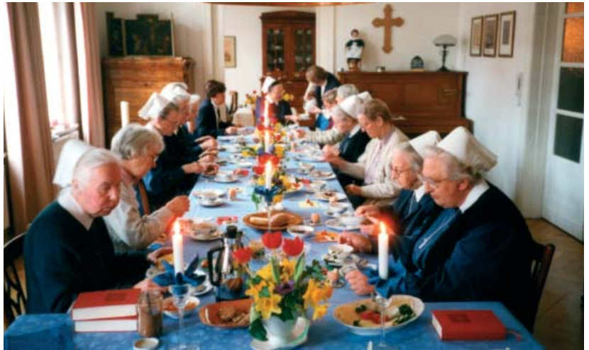
Die „Villa 9“ im Marienhölungsweg diente lange Jahre als „Haus der Diakoniegemeinschaft“ (oben), nun bildet Haus Pniel mit seinem großen Saal das neue Zentrum.

Nichts bleibt, wie es ist, das wussten schon die alten Griechen: So ergab sich durch die Entwidmung des Feierabendhauses Pniel, das aus baulicher Sicht nicht mehr den Anforderungen einer Alten- und Pflegeeinrichtung entsprach, neuer Raum für die stets anwachsenden Aktivitäten der Diakoniegemeinschaft. Die Oberin und ihre Stellvertretung zogen mit Vorstand, Öffentlichkeitsarbeit, Controlling, Ethikreferat u.a. in den Verwaltungsflur. Neben allem, was schon erwähnt wurde und auch weiter gepflegt wird, gibt es nun im Südflügel des Hauses Pniel neue Möglichkeiten für das Gemeinschaftsleben. Der große Saal, der aus der Zusammenlegung des früheren Speisesaales mit dem Andachtsraum und weiteren Zimmern entstand, bietet Platz für Theateraufführungen, Konzerte, Vorträge, Lesungen, Kantoreiprobieren, Geselligkeit und Festveranstaltungen. Ein „Schwesternwohnzimmer“, ein Andachtsraum und ein kleines Café sowie umfangreiches Beherbergungspotential für Gäste und Bewohner