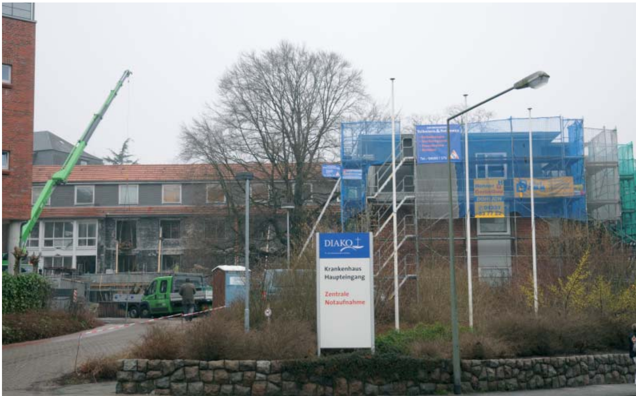
Jetzt geht's wieder voran: Die Umbauten und Erweiterungen der DIAKO-Psychiatrie und der Dialyse sollen bis Ende des Jahres fertig sein.

vonnöten, um eine angemessene Zimmergröße zu erreichen.